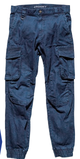
ジョガーパンツ RP6905 ¥6,600+税