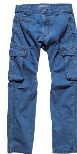
カーゴパンツ RP6903 ¥6,600+税