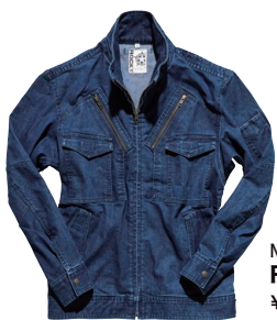
フライトジャケット RJ0904 ¥7,700+税