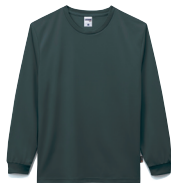
22 チャコールグレー