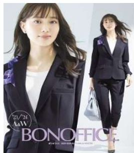
BONOFFICE '23-'24 AW