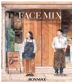
FACE MIX 2023