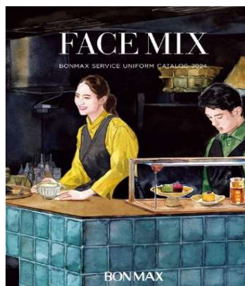
FACE MIX 2024