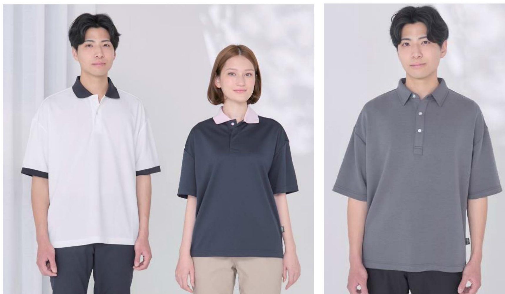
左から)【男性】ユニセックスポロシャツ (BKB4501)、【女性】ユニセックスポロシャツ (BKB4502)、【男性】ユニセックスポロシャツ (BKB4503)

汗をニオイにしない！抗菌防臭加工「ポリジン・ステイフレッシュ」を採用したバイカラーポロシャツと、優しい肌触りの「ダンボールニット」素材のポロシャツがデビュー！トレンド感のあるオーバーシルエットも特長です。