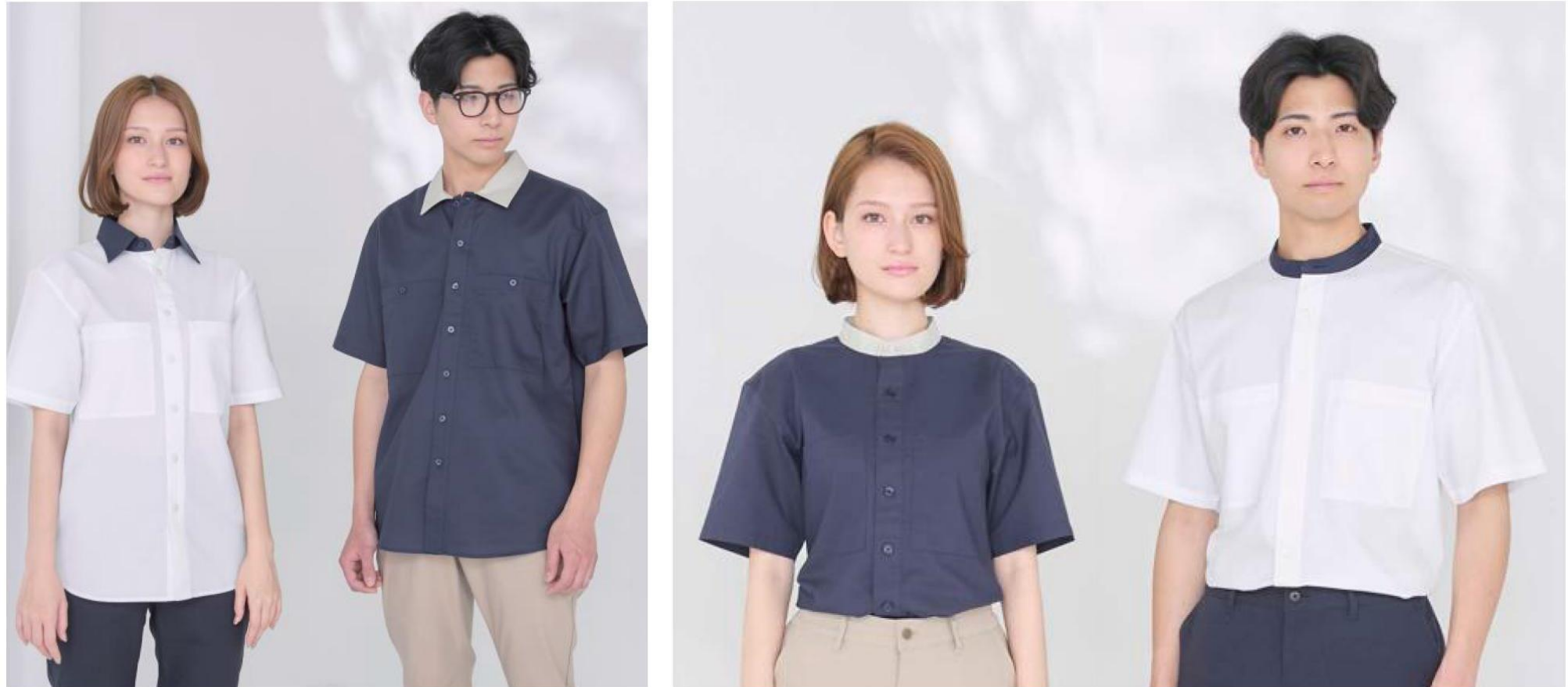
左から)【女性】ユニセックスレギュラーカラーシャツ (BKB4505)、【男性】ユニセックスワイドカラーシャツ (BKB4504)、 【男女】ユニセックスバンドカラーシャツ (BKB4506)

3種類の襟のデザインから選べるシャツシリーズ！こだわりのシルエットで、きちんと感をプラスしました。ネイビーストライプには、抗菌防臭加工「ポリジン・ステイフレッシュ」を採用！また、人と地球にやさしい繊維 製品の証「エコテックス®メイドイングリーン」該当アイテムです。