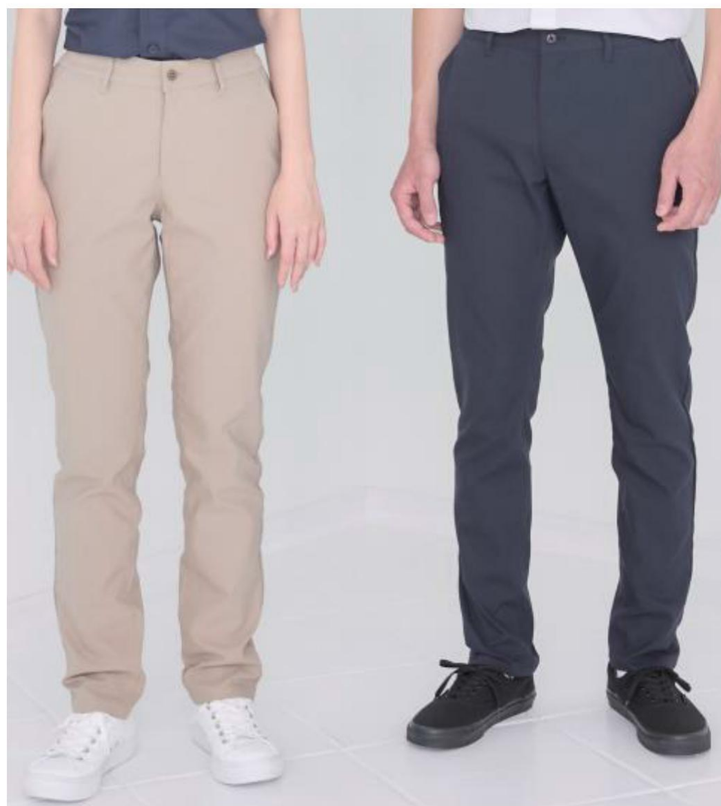
左から) レディーススキニーパンツ (BKP6301)、メンズスキニーパンツ (BKP6001)

スッキリとしたシルエットのスキニーパンツ。レディスとメンズの2デザイン。吸汗速乾性があり、動きやすい素材でケアシーンでも快適にご着用いただけます。後ろウエストゴムでサイズ変化にも柔軟に対応します。