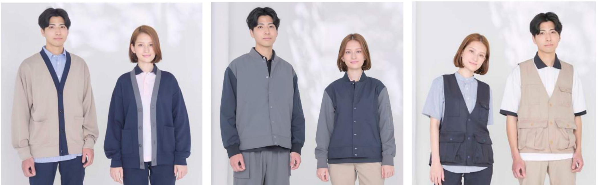
左から)【男女】ユニセックスカーディガン (BKJ0703)、【男女】ユニセックスジャケット (BKJ0702)、【男女】エプロンベスト (BKV1701)

エプロンベストは、配膳などのケアシーンで便利なアイテム。ベスト感覚で着られるエプロンは、マチ付きポケットで高い収納力も魅力です。幅広いシーンで活用いただけます。