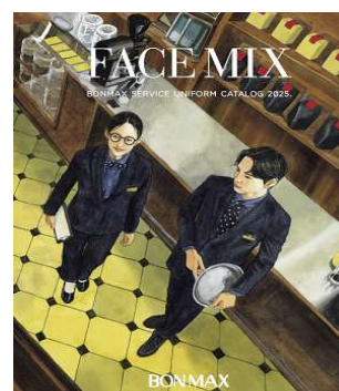
FACE MIX 2025