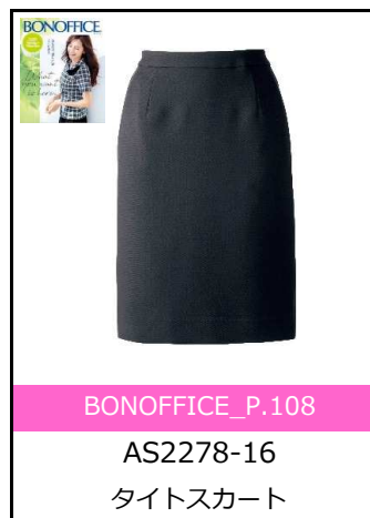
4/30 第3話で瑛蓮さん着用