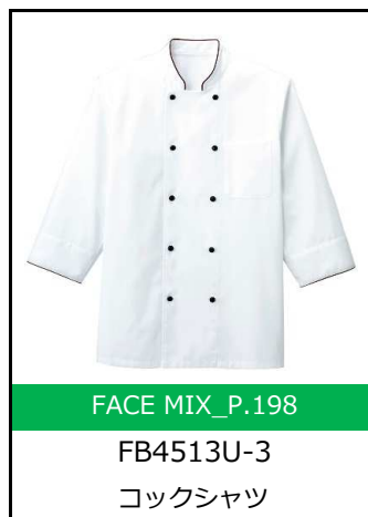
5/7 第4話 シェフ役の落合 モトキさん着用