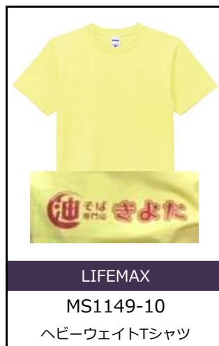
第4話ゲスト 山本直寛さん着用「油そば専門店 きよた」柄