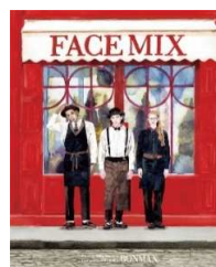
FACE MIX 2020