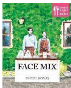
FACE MIX 2021