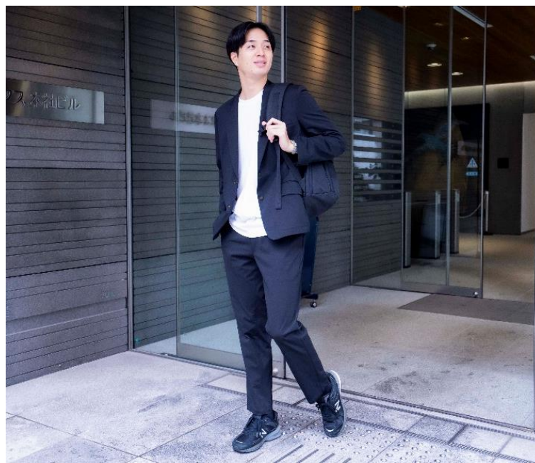
動けるらくらくスーツ（メンズジャケット・パンツ）

2022年2月発刊のサービスウェアカタログ「FACE MIX」より、『動けるらくらくスーツ（メンズジャケット・パンツ）』の販売を開始します。当商品は、ニット素材（PRIMEFLEX®/東レ）を採用し、ユニフォーム専門メーカーとしてどんな場面でも着用可能な優れたストレッチ性・軽量感・快適な着心地という3つの“らくらく”を追求しました。サービスシーンからワークシーンまで幅広いワーカーに合わせたストレッチスーツです。